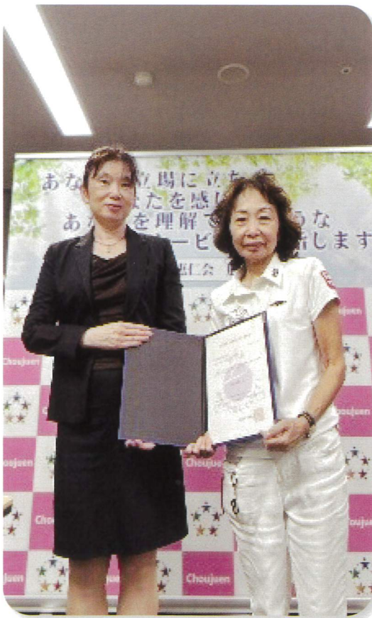
女性活躍推進企業として「えるぼし認定」最高位（3つ星）を取得

今後も、職員の多様な価値観やライフスタイルを尊重しながら、誰もが活躍できる職場環境の実現に向けて取り組みを強化してまいります。