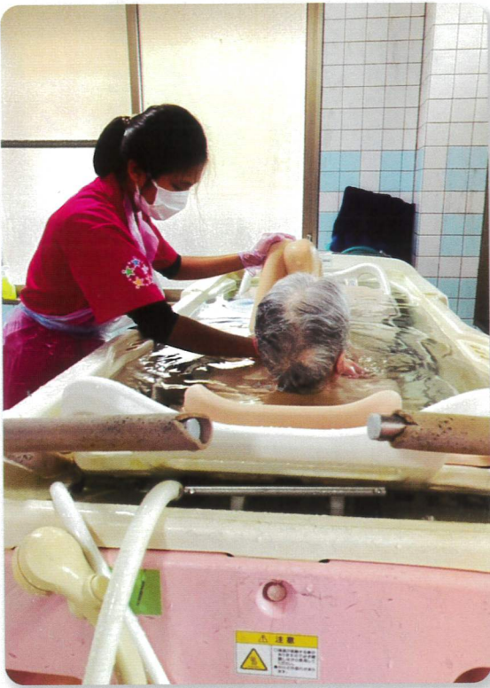
ソーさん入浴介助中の様子