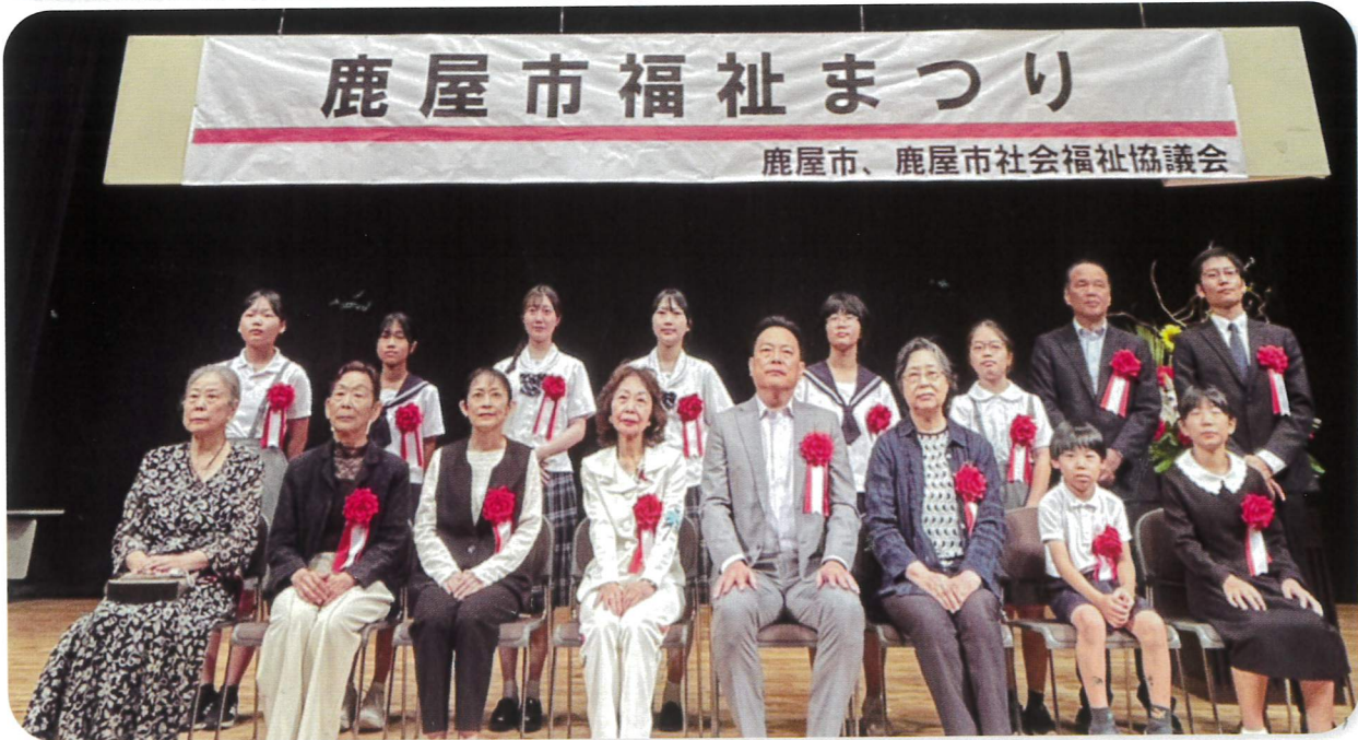
他部門受賞者との集合記念撮影