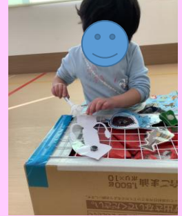
バーベキューごっこ