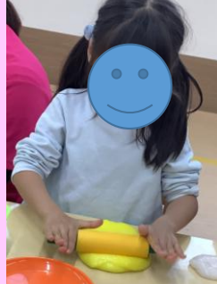
ふわふわスライム遊び